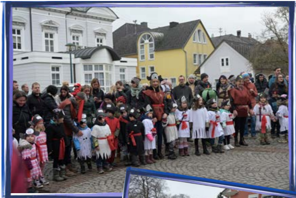
Piraten und Seeräuber feierten ausgelassen beim Faschingsfest der Kindergärten in Grünburg.