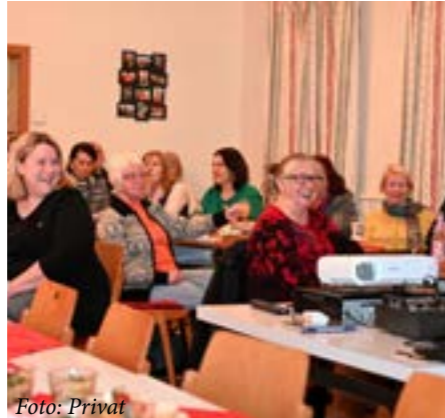
Filmabend im Gressenbauerheim

standen angeregte Diskussionen zum Thema. In diesem Zusammenhang ergeht ein großes Dankeschön an den Verein „Für uns – Zentrum für Zivilgesellschaft“, der die DVD zur Verfügung gestellt und die Anmeldung der Veranstaltung übernommen hat.