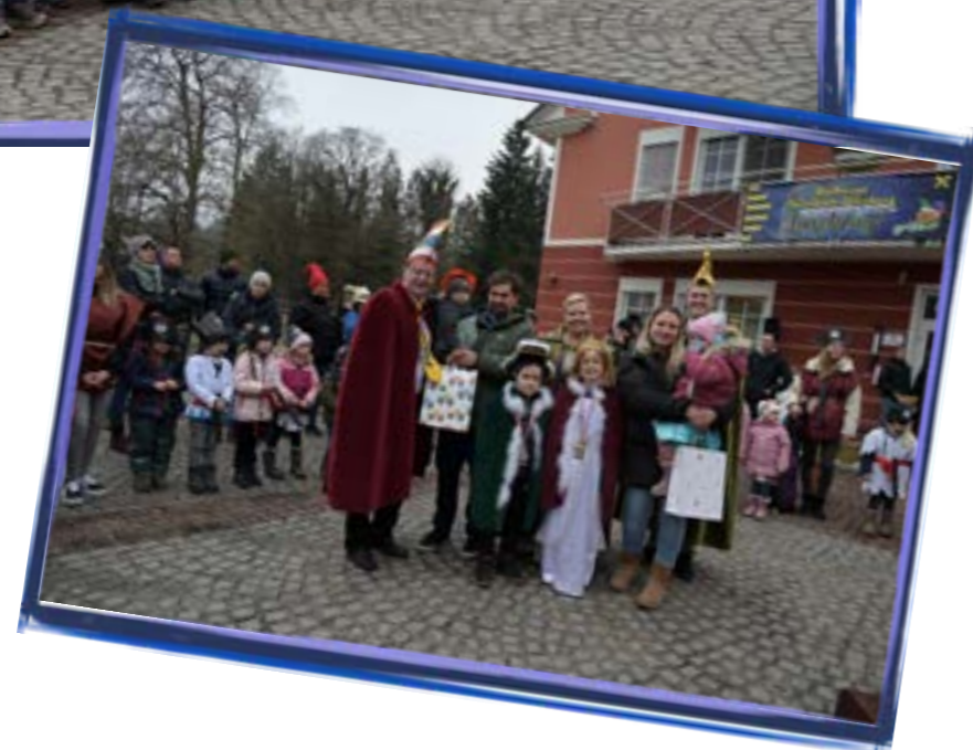
Nach dem Luftballonstart, ist vor dem Luftballonstart: Die Gewinner des letzten Luftballonstartes mit den Prinzenpaaren.