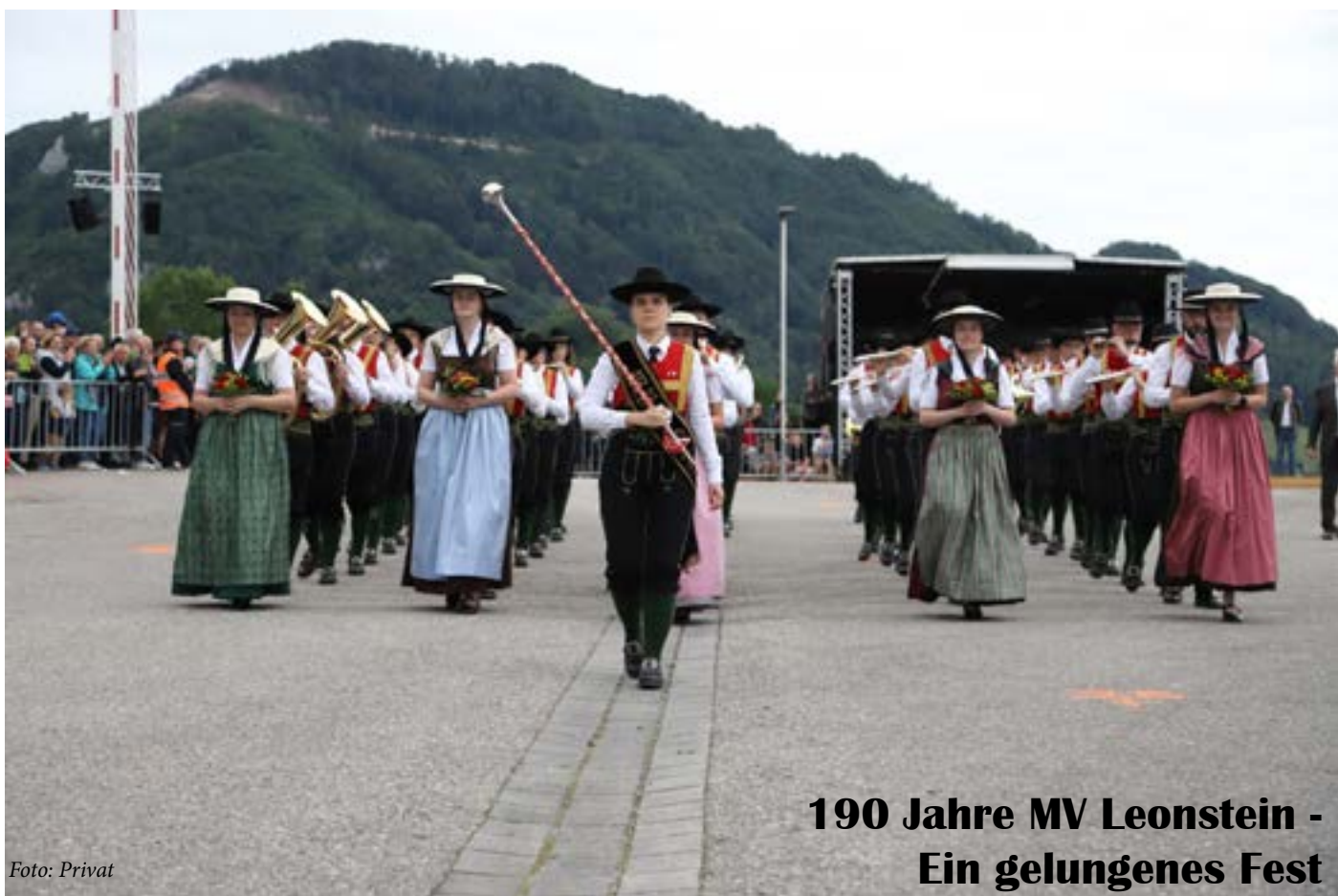
190 Jahre MV Leonstein - Ein gelungenes Fest